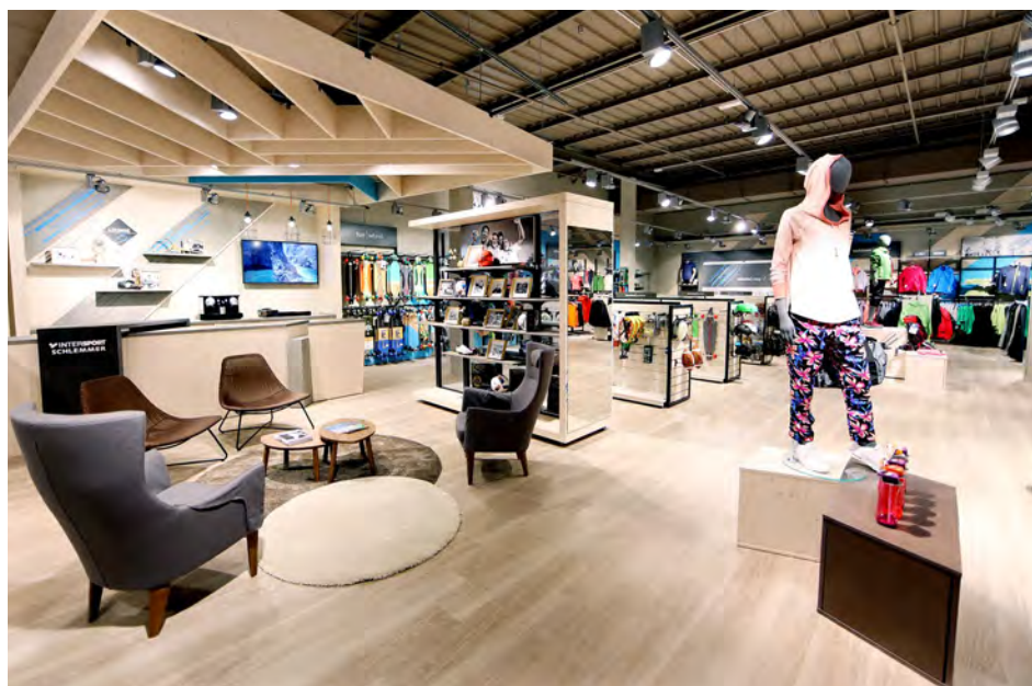
Hell und geräumig: Bei Intersport Schlemmer finden sich auf der gesamten Verkaufsfläche verschiedene dezentral angeordnete Servicebereiche.

Innenraum und umgebender Ladenfläche her. Besonders sind dabei die hochwertige Ausstattung mit schicken weißen Möbeln und Leuchten sowie die Lage inmitten des Verkaufsraums, die auch für weitere Warenpräsentationen hätte genutzt werden können. Doch dem Händler war es wichtiger, dass für die Vereine ausreichend Platz zur Verfügung steht.